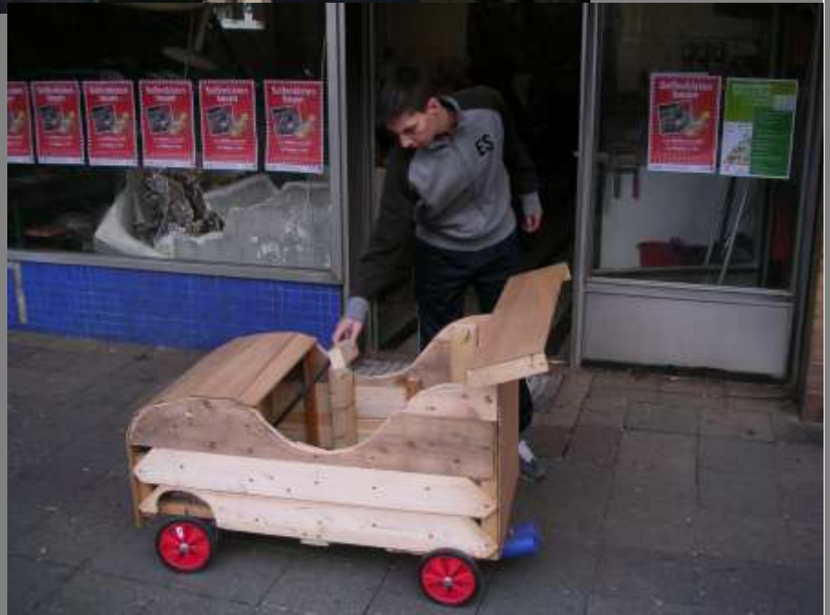
Seifenkistenprojekt Herbst 2007 – Juleica´s im Einsatz