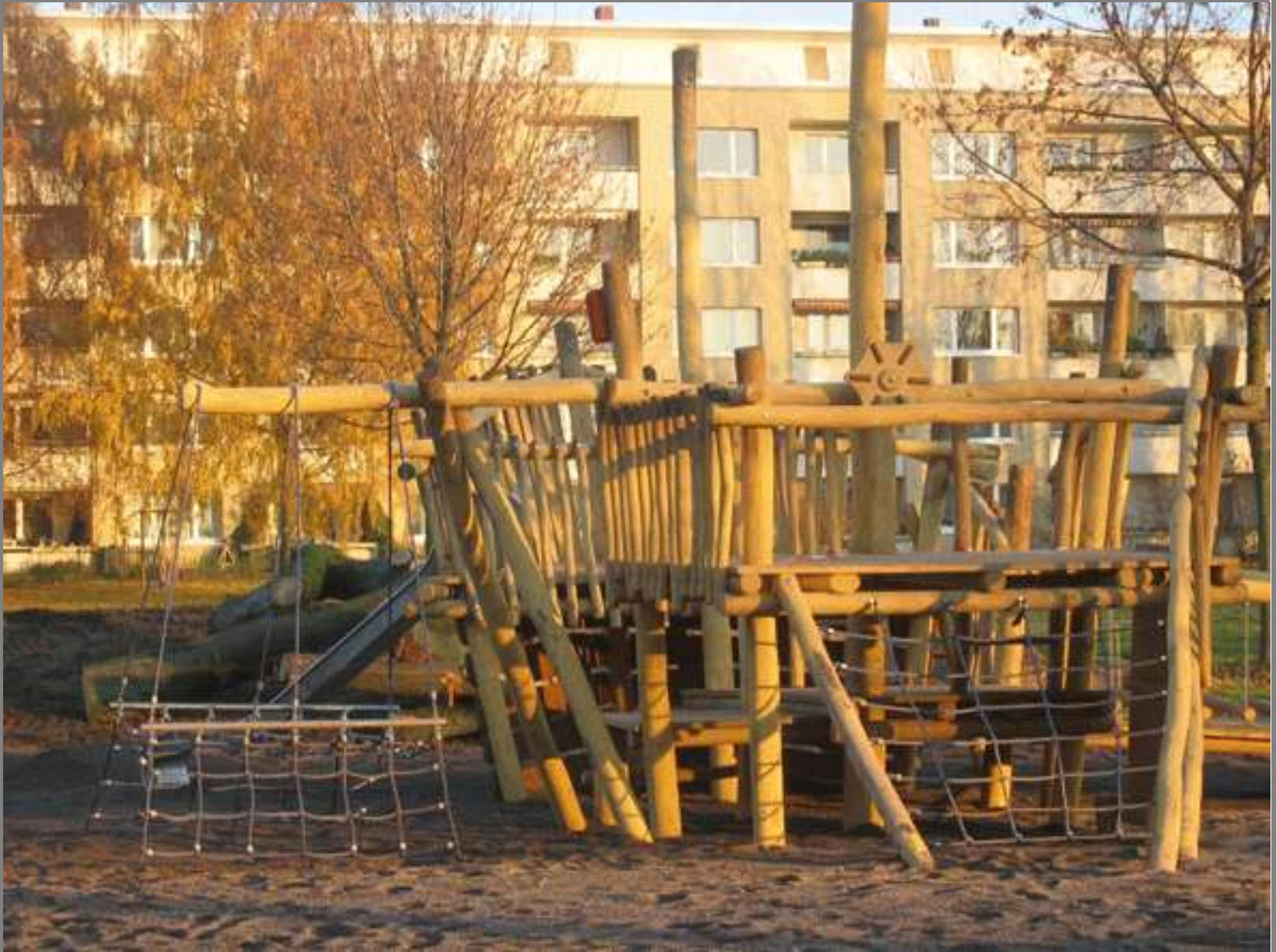
Spielschiff auf dem neuen Kinderspielplatz