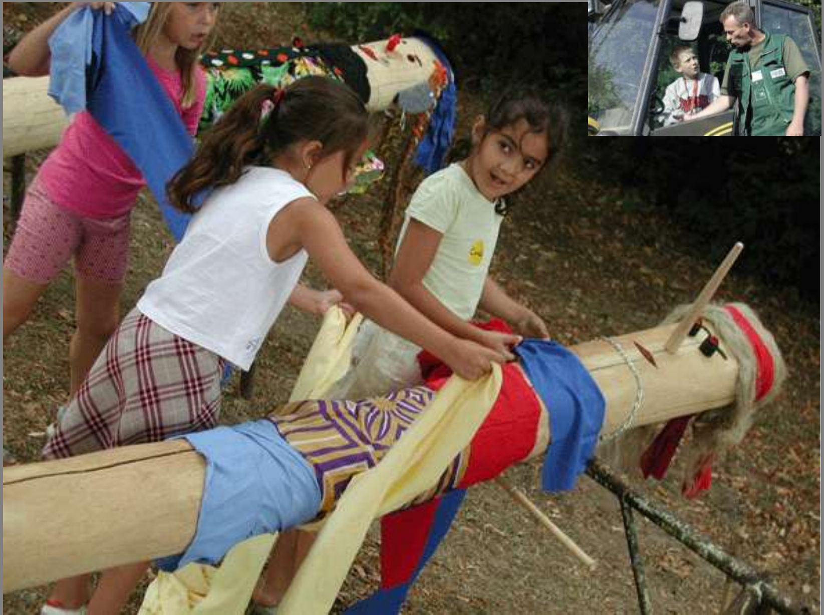
Kinder bauen Schutzgeister – Baustellenbesichtigung verkürzt Wartezeit