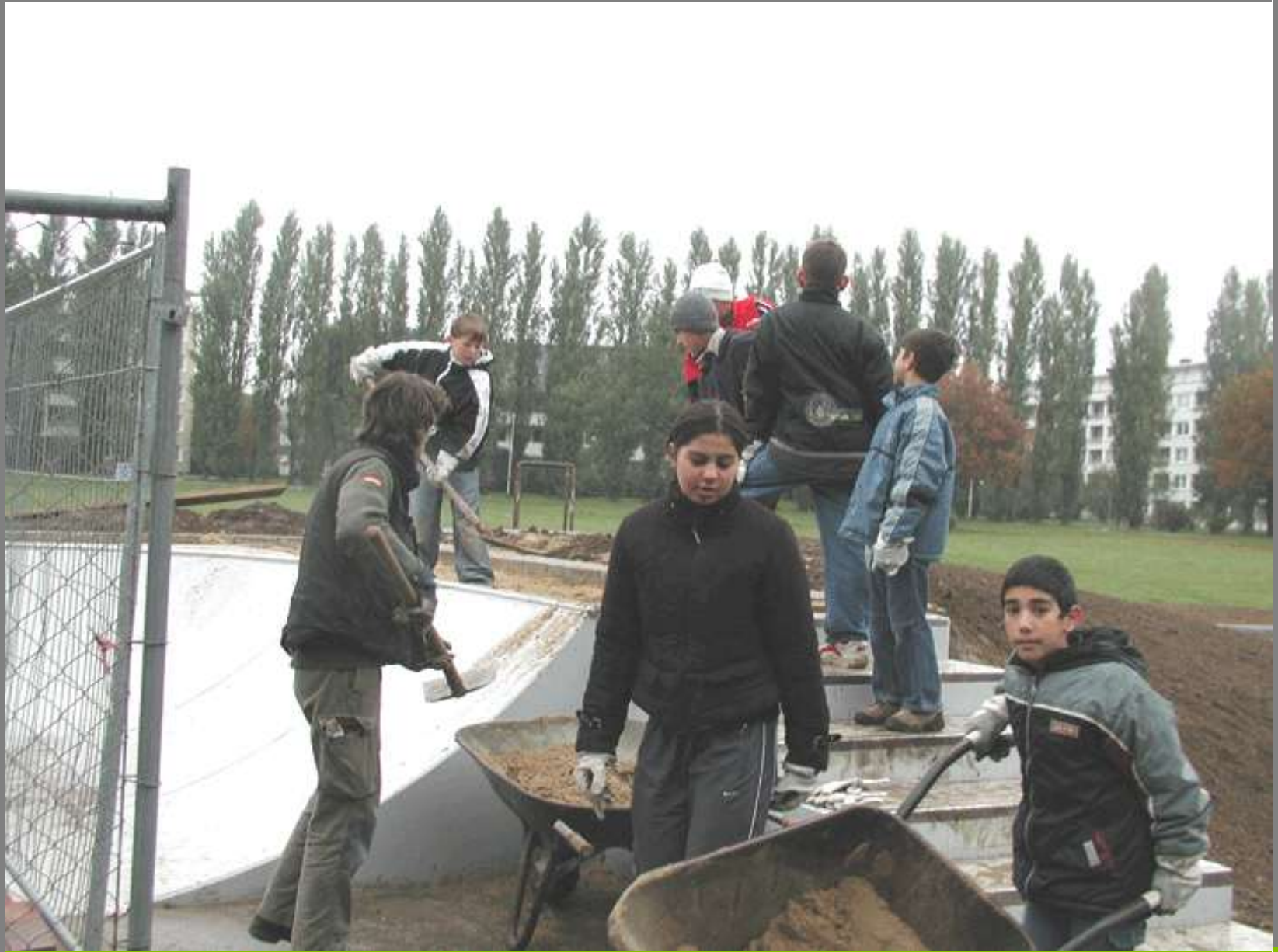
Bau der Skaterbahn auf der neuen Jugendfreizeitanlage