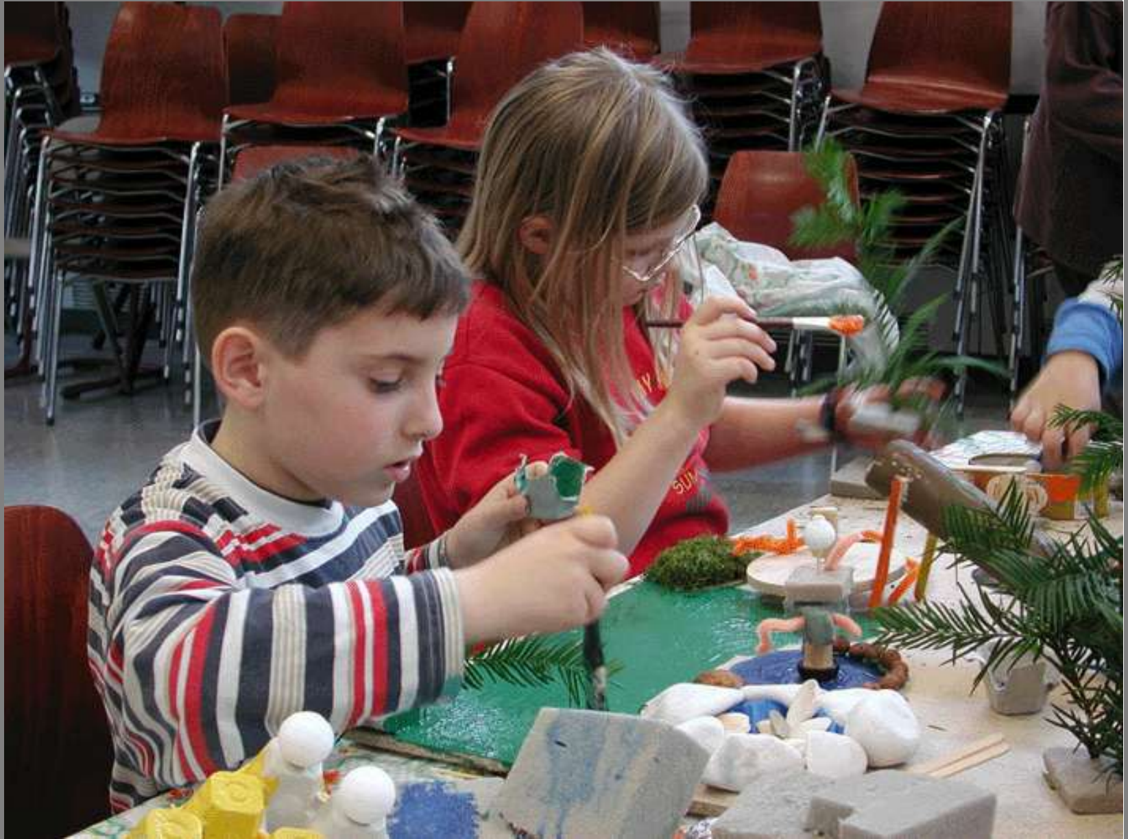
Kinder basteln ihren Wunschspielplatz