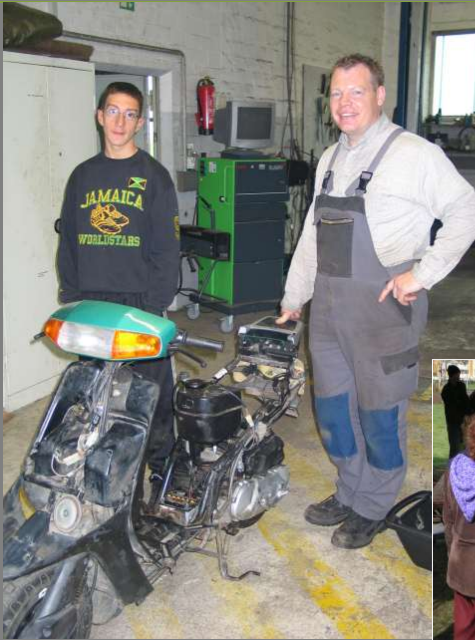
Zur Erinnerung - vor 3,5 Jahren: