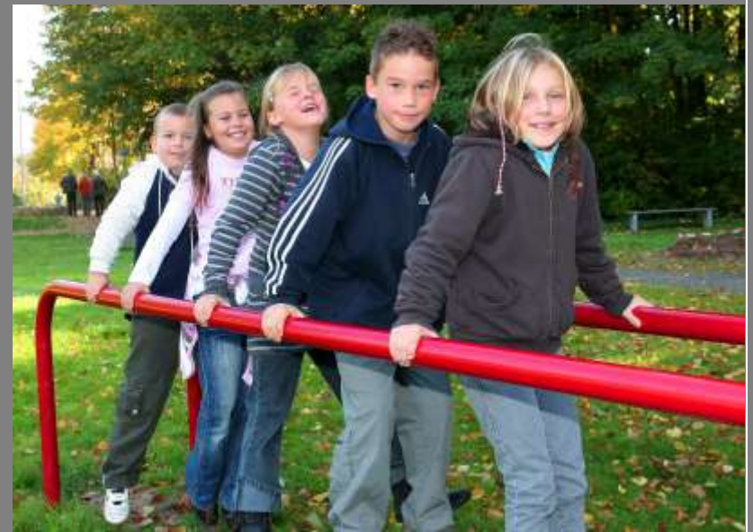
Bau des Trimm Dich und Kraftsportpfades im Jahr 2008/ 2009